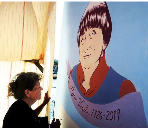
Peinture murale de Barbara Carrasco réalisée sur les murs de la Pointe Courte.