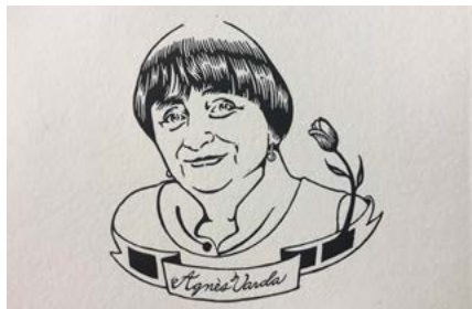
Barbara Carrasco, gravure sur bois, 2019