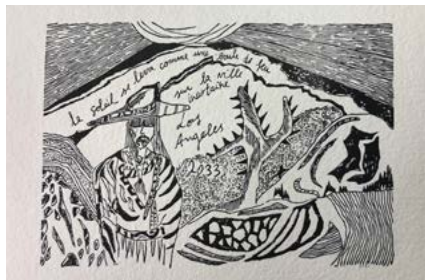
Vanessa Atlan, gravure sur bois, 2019