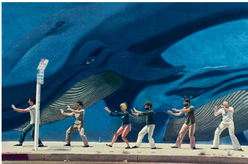
Mur Murs, Agnès Varda (extrait)